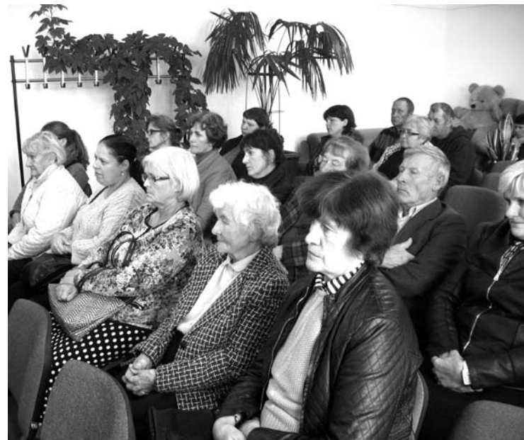
Į Troškūnų seniūnijos salę susirinko ir Raguvėlės bei Surdegio kaimų atstovai, kurie kalbėjo apie savo rūpesčius.