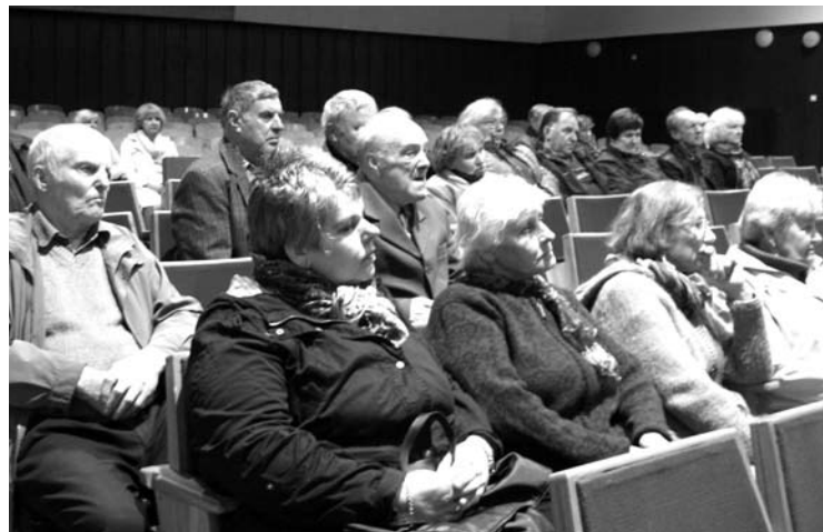
Svėdasiškiai prašė mero remontuoti miestelio šaligatvius, spręsti nuotekų problemą, rūpintis apleistais pastatais.

pasakojo apie kuriozinį atvejį. Jis sakė, kad buvo atėjęs vienos siuzyklos savininkas ir prašė neleisti Anykščiuose kurtis naujoms įmonėms. „Kai atsidarė „Balticsofa“, iš manęs bėga žmonės, nes jie moka 50 eurų daugiau“, – pokalbį su verslininku perpasakojo meras K. Tubis. Jis aiškino, kad Anykščiuose mažėjant šilumos kainai ir daugėjant darbo vietų, auga nekilnojamojo turto vertė, o nuomojamų butų mieste praktiškai nebėra. „Šiemet pirmi metai, kai migracijos rodiklis pliusinis“, – Troškūnuose džiaugėsi meras. „Tai čia dėl mūsų čigonų“, – juokėsi salė.