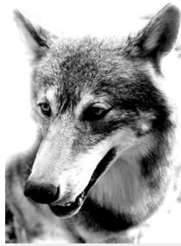
Pernai buvo užregistruoti 192 atvejai, kai vilkai padarė žalos ūkiniams gyvūnams.

– leidžiama sumedžioti 60 vilkų. Toks skaičius nustatytas, remiantis rekomendacijomis, kurias Aplinkos ministerijos prašymu pateikė mokslininkai. Nustatant limitą taip pat atsižvelgta į vilkų apskaitos duomenis ir jų padarytą ūkiniams gyvūnams žalą. Apskaitos duomenimis, Lietuvoje gyvena ne mažiau kaip 292 vilkai. Pernai iki rugsėjo 1 dienos, savivaldybių administracijų pateiktais duomenimis, buvo užregistruoti 192 atvejai, kai vilkai padarė žalos ūkiniams gyvūnams – 32 proc. daugiau nei per tą patį laiką 2014 metais.