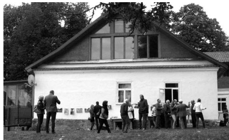
Akimirka iš renginio...

Kūrėjai papasakojo apie filmo idėją, medžiagos rinkimą. Filmas nėra gavęs valstybinio finansavimo, jo kūrimą remia partizanų vaikai ir kiti privatūs rėmėjai. Šiuo filmu siekiama