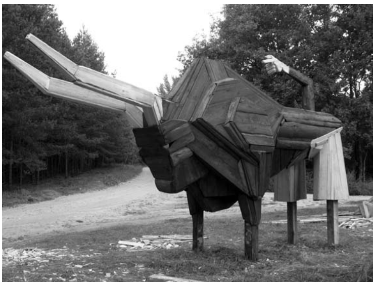
Žilvino Smalско „jautis „su triusikais“ bus savotišku Vyganto Šližio valdų riboženkliu.

(Atkelta iš 1 p.) Paroda šalia namo, kuriame verslininkas užaugo