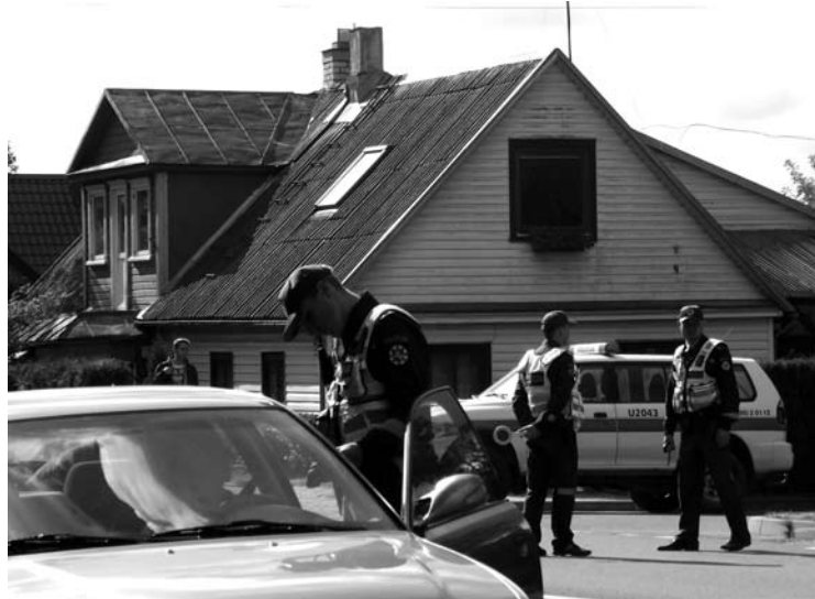
Policininkų ekipažai stabdė ir į Anykščius įvažiuojančias, ir iš miesto išvažiuojančias transporto priemones.

Tiesa, įvyko ir vienas nesusipratimas – sustabdžius automobilį, jį vairavusi moteris, pūstelėjusi į alko- testerį, ekrane išvydo užrašą „alkoholis“. Policininkai paprašė moters