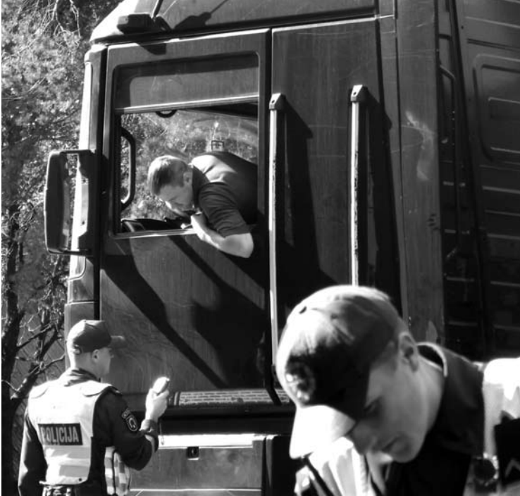
Pareigūnai tikrino ne tik lengvųjų automobilių, bet ir krovinių mašinų vairuotojų blaivumą.

Trečiadienį Anykščių rajono policijos komisariato pareigūnai vykdė atsitiktinių transporto priemonių vairuotojų blaivumo patikrinimus. Mieste buvo pasirinktos dvi vietos, kur, pasak pareigūnų, buvo siekiama patikrinti kuo daugiau vairuotojų. Vieni policininkų ekipažai stovėjo prie „Bikuvos“ parduotuvės, dar du ekipažai vairuotojų blaivumą tikrino netoli posūkio į Niūronis.